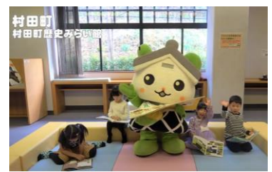
▲『仙南地域のゆるキャラと行く!! おやこのおでかけスポット』より