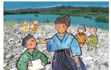
▲『さつきばれ 小野訓導物語』より