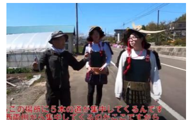
▲『笹谷街道を見下ろす巨大山城 小野城跡』より