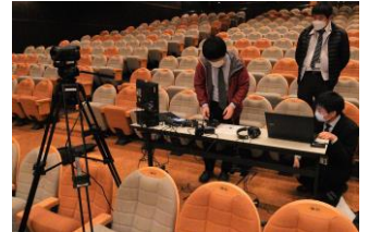
▲大河原町成人式典