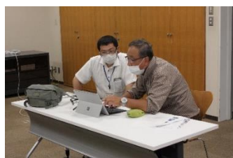
▲ゆっくり丁寧に進めていきます