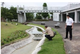
▲外に出て実際に撮影してみます