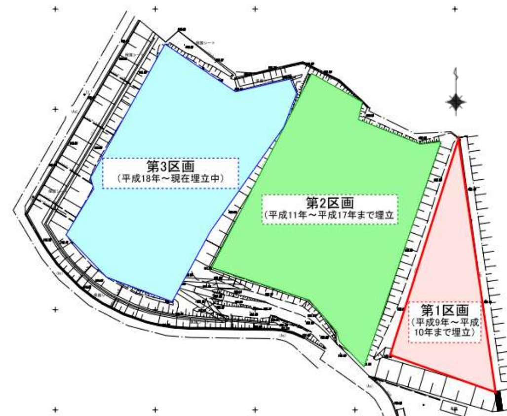
図 2 仙南最終処分場の埋立状況