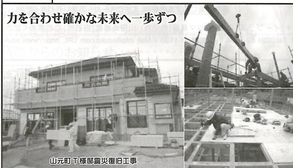
山元町丁棟部震災復旧工事