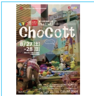
▲「ちょこっと」公演チラシ