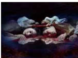
▲旅とあいつとお姫さま公演より