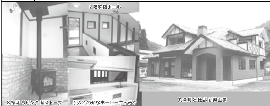
S様邸 リビング 薪ストーブ 手入れの楽なホーローキッチン 丸森町S様邸 新築工事