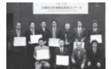
▲仙南地区代表 入賞者