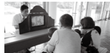
紙芝居コーナーでは視聴覚教材センター保有の紙芝居を見て頂きました。