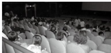
大ホールでは、昨年公開された「WALL・Eウォーリー」を上映しました。

去る9月13日にえぞこホールにて、平成21年度視聴覚教材センターフェスティバルが開催されました。1000人を超えるご来場をいただき、ありがとうございました。