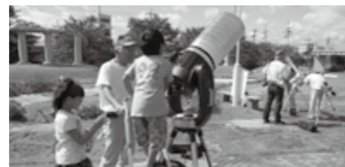
企画展示ブースとして柴田町星を見る会のメンバーの方々による太陽望遠鏡で太陽観察をしました。