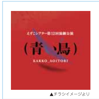
▲チラシイメージより