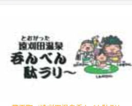
蔵王町 / 遠刈田温泉呑べん駄ラリ~