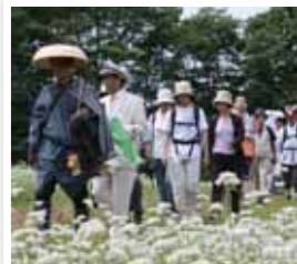
七ヶ宿町 / わらじで歩こう七ヶ宿