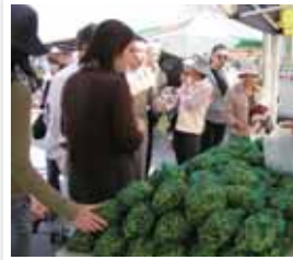
角田市 / 角田ずんだまつり