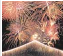
大河原町 / おおがわら夏まつり