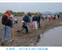
丸森町 / 全日本石投げ選手権