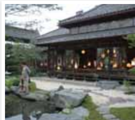
白石市 / 白石和紙あかり展示会