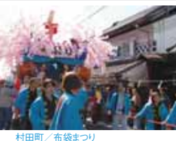
村田町 / 布袋まつり