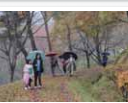
丸森町 / 丸森ウォークラリー大会