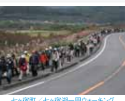
七ヶ宿町 / 七ヶ宿湖一周ウォーキング