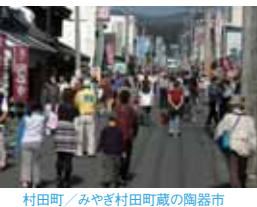
村田町 / みやぎ村田町蔵の陶器市