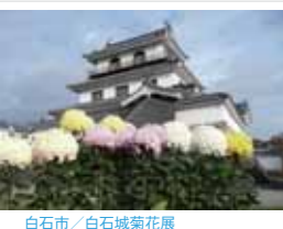
白石市 / 白石城菊花展