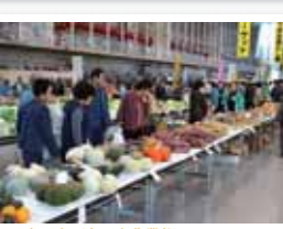
白石市 / 白石市農業祭