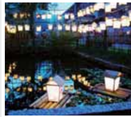
丸森町 / 齋理幻夜