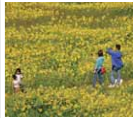
丸森町 / 館矢間ひまわりまつり・佐野ひまわりまつり