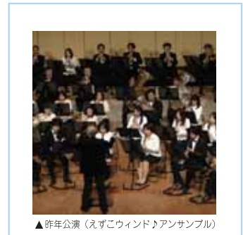
▲昨年公演 (えぞこウィンドアンサンブル)

◎料金 [全席指定] 前売 2,500円、学生1,600円 (当日各500円増) ◎前売り開始/10月17日(土)