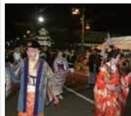
白石市 / 白石音頭パレード