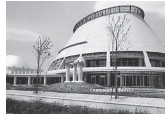
▲仙南芸術文化センター(えぞこホール)