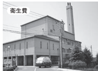
▲角田衛生センター