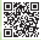
詳細はこちら (組合 HP)

組合が作成する有料指定ごみ袋は、圏域住民の目に触れる機会が多いため、外袋への広告掲載は事業内容をPRするのに適しています。事業者やお店の紹介などにこの機会をご利用ください。