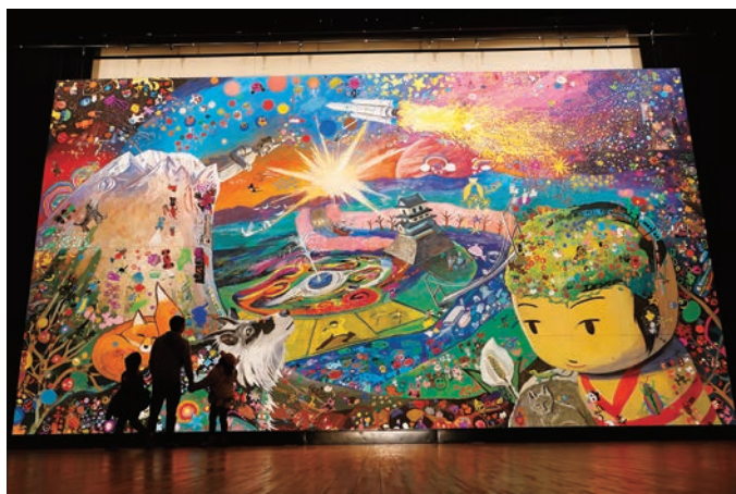
▲ 舞台上で使用された巨大画(縦7m×横12m) 大きさと、画に込められたエネルギーに圧倒される作品です。(左下の人影と比較するとその大きさにビックリ!)

令和5年2月11日(土)・12日(日)の2日間、えずこホールを会場に、AZ9(あずないん)ジュニア・アクターズ結成30周年記念公演「アズランド」つづくつながる物語」が上演され、2日間で773名の方にご鑑賞いただきました。 当劇団は、平成5年に結成され、阿武隈川(A)と蔵王連峰(B)を共有する仙南圏域の9つの自治体の小学4年生から6年生で構成する児童劇団です。 毎年2月に公演を重ね、30回目を迎えた今回の公演は2部構成で行われ、第1部では、第1期生から第27期生ま