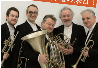
Quintette de Cuivres de l'Orchestre de Paris

最高峰の金管五重奏、名門「パリ管」の首席ソロ奏者 5 人が彩るフレンチ・ブラス・サウンド。卓越した技術と洗練された音楽性ですべての音楽ファンを魅了する!!