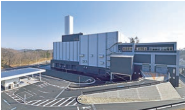
仙南クリーンセンターごみ搬入Web予約システム