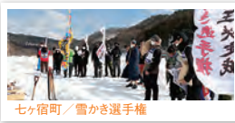
七ヶ宿町 / 雪かき選手権