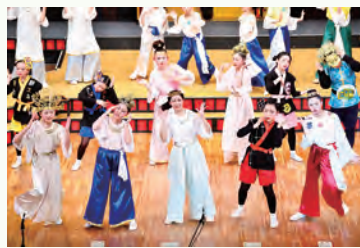
▲AZ9ジュニア・アクターズ 第28回演劇公演

仙南地域の阿武隈川(A)と蔵王連峰(Z)の環境を共有する9つの自治体※の小学4年生から6年生で構成された児童劇団「AZ9ジュニア・アクターズ」は、平成5年度に結成し、これまで活動を続けてきました。活動30周年の節目となる今年度、記念演劇公演を行います。