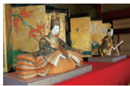
角田市／企画展「雛人形」