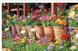
柴田町／しばたスプリングフラワー・フェスティバル