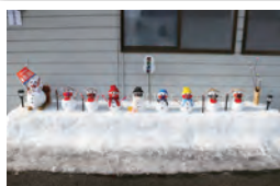
七ヶ宿町／雪だるま・雪像コンテスト