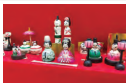
蔵王町／こけしびなまつり