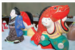
村田町／つつみ人形展示及び美演