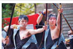
丸森町／小斎鹿島神社奉射祭「やぶさめ」