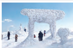
蔵王町／雪化粧のみやぎ蔵王御釜ツアー