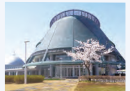
▲仙南芸術文化センター (平成8年10月開館)