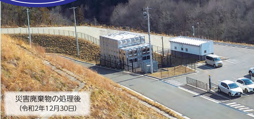
災害廃棄物の処理後 (令和2年12月30日)