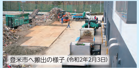
登米市へ搬出の様子 (令和2年2月3日)

放射性セシウム濃度 8,000Bq/kg以下の農林業系廃棄物の焼却は、災害廃棄物を最優先で処理するために中断していましたが、災害廃棄物の処理が完了しましたので、令和3年5月以降に準備が整い次第、仙南クリーンセンターにおいて焼却を再開することとしています。