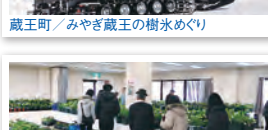
村田町 / クリスマスローズ展