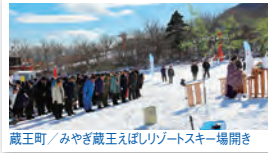
蔵王町 / みやぎ蔵王えぼしリゾートスキー場開き