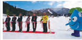
七ヶ宿町 / みやぎ蔵王七ヶ宿スキー場オープン式