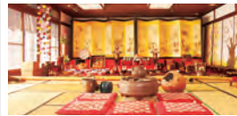
丸森町 / 齋理屋敷企画展「齋理の歳迎え」