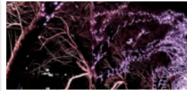
大河原町 / おおがわら桜イルミネーション