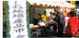
角田市 / ひがしね地場産品市