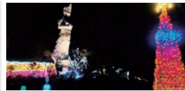
柴田町 / Shibata Fantasy Illumination