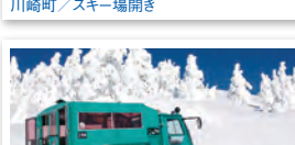
蔵王町 / みやぎ蔵王の樹氷めぐり