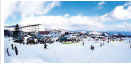
蔵王町 / マウンテンフィールド宮城蔵王すみかわスノーパークスキー場開き