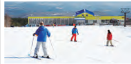
白石市 / スキー場開き