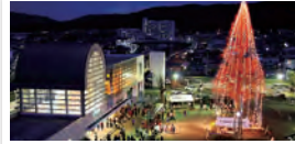
柴田町 / メタセコイアの奇跡!光り輝け槻木駅