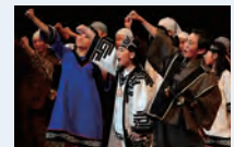
▲AZ9ジュニア・アクターズ第27回公演「こけしくと二ポポちゃん～白石侍北へ行く～」

AZ9ジュニア・アクターズ養成・公演事業、社会教育施設を利用できるAZ9パスポート事業などを行い、圏域の未来を担う人材育成を行いました。