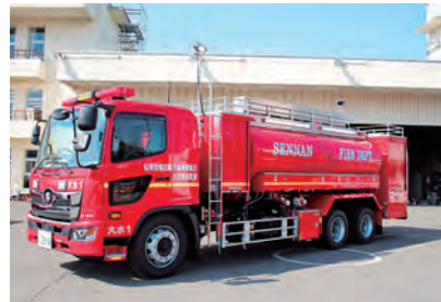
小型動力ポンプ付水槽車

消防車両(普通消防ポンプ自動車(角田消防署)、高規格救急自動車(角田消防署丸森出張所)、小型動力ポンプ付水槽車(大河原消防署)、指揮隊車(消防本部))の更新、新規配備するなど、安心・安全を守る圏域づくりに取り組みました。