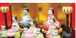
蔵王町／こけしびなまつり