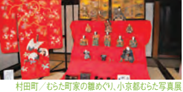
村田町／むらた町家の雛めぐり、小京都むらた写真展