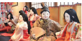
丸森町／齋理屋敷企画展「齋理の雛まつり」