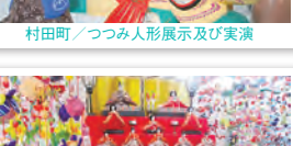
角田市／かくだ牟宇姫ひなまつり