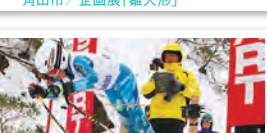
七ヶ宿町／七ヶ宿ジャイアントスラローム大会