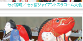
村田町／つつみ人形展示及び実演