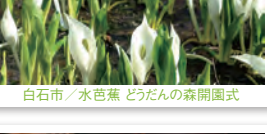
白石市／水芭蕉 どうだんの森開園式