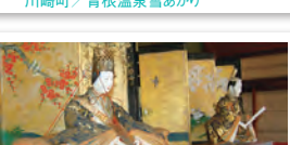
角田市／企画展「雛人形」