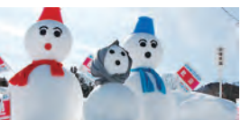
七ヶ宿町／雪だるま・雪像コンテスト