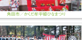
丸森町／小斎鹿島神社奉射祭(やぶさめ)