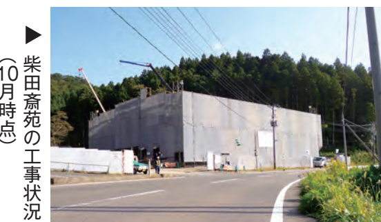
▶ 柴田斎苑の工事状況 (10月時点)

平成31年4月からの 供用開始を予定してい る柴田斎苑の進捗状況 は、平成30年10月末時 点で38%が終了してい ます。 現在は、建築工事が 本格化しており、供用 開始に向け、順調に工 事が進んでいます。