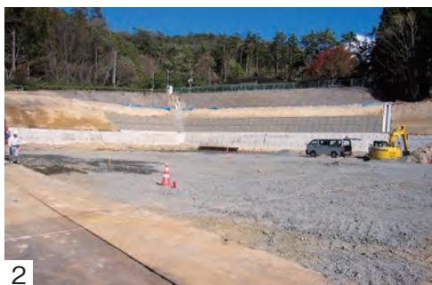
1. 新白石斎苑 正面玄関イメージ図 2. 白石斎苑の工事状況 (10月時点)

成30年10月末時点で 20%が終了していま す。 工事は次のスケ ジュールのとおり実 施する予定であり、 新斎苑の供用開始後 に現斎苑の解体を行 い、跡地に新たな駐 車場を整備します。