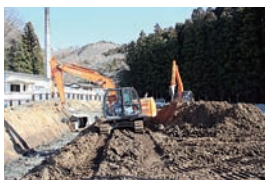
(工事状況：平成30年2月現在)