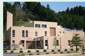
柴田衛生センター (昭和60年10月供用開始)

角田・柴田両し尿処理施設は、供用を開始して30年以上が経過していることから、施設の長寿命化の適否等について、専門業者に調査業務を委託する経費を計上