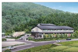
(柴田斎苑完成イメージ)

白石斎苑は、来年10月の供用開始に向けて、5月から造成工事が始まる予定です。柴田斎苑は、現在、造成・建築工事等を順調に進めております。(写真：柴田斎苑)