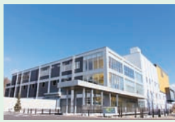
仙南クリーンセンター