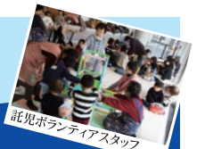
託児ボランティアスタッフ