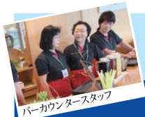
バーカウンタースタッフ