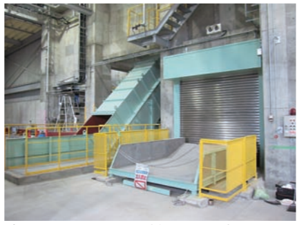
係員の指示に従い、ダンピングボックス前に搬入物を降ろしてください。