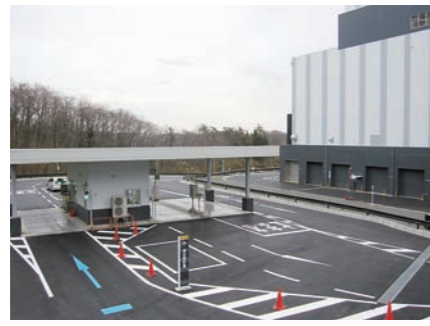
計量棟に戻り精算のうえ、搬入車専用出入口より退場します。