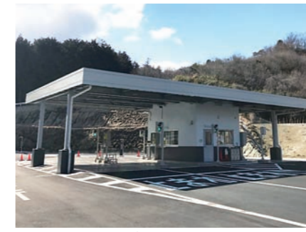
計量棟で受付を行います。