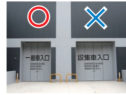
一般車は左側から入場してください。