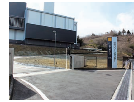
搬入車専用の出入口より入場します。