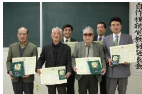
昨年度(第36回)の受賞者のみなさん

出品条件、発表時間等詳しくは視聴覚教材センターホームページをご覧ください。視聴覚教材セン ター(0224-52-3433)までお問い合わせください。