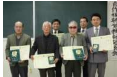
昨年度(第36回)の 受賞者のみなさん