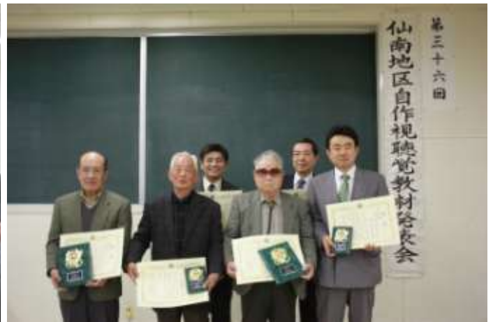
入賞者のみなさん