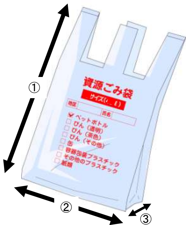
図1 資源ごみ袋の寸法