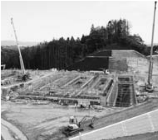
平成27年6月現在の状況 (ごみ処理施設建設場所)