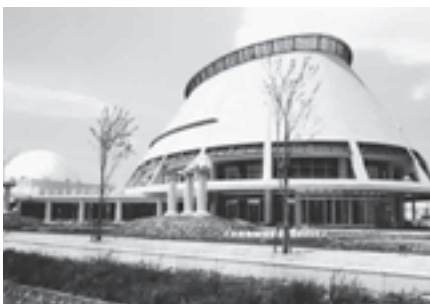
仙南芸術文化センター（えぞこホール）