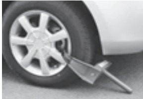
タイヤロック装着例